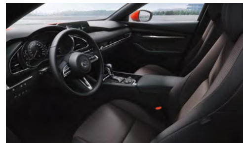
Материал обивки салона - ткань